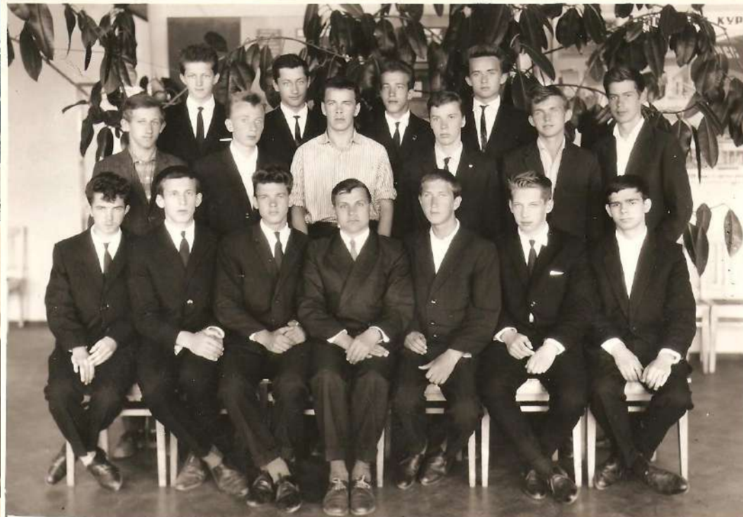
Allyncester's niece Beenaon 1964.

...ed at her watch, "What time were you... ...as possible. It doesn't matter. She'll wait." ...er waiting. Before you go there's one more... ...er waiting and see the color film